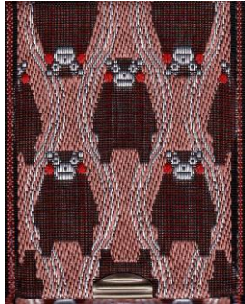
L-12 くまモン (桃)