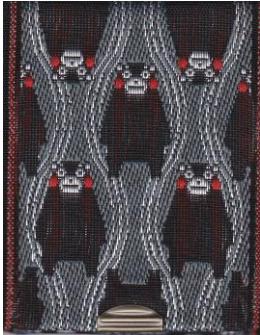
L-11 くまモン (灰)