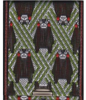
L-14 くまモン (緑)